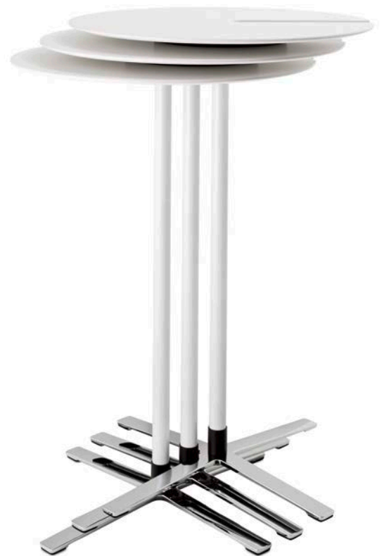
Modell 236/3 Verblüffend praktisch: Die quadratischen und runden Stehtische gibt es wahlweise mit schlitzförmigen Aussparungen in der Tischplatte – dadurch lassen sich bis zu drei Stehtische platzsparend stapeln.